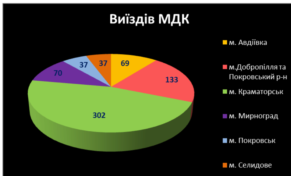
Виїзди МДК по містам:

З 01.03.2021 р. по 30.06.2021 р. було здійснено 648 виїздів команди МДК.